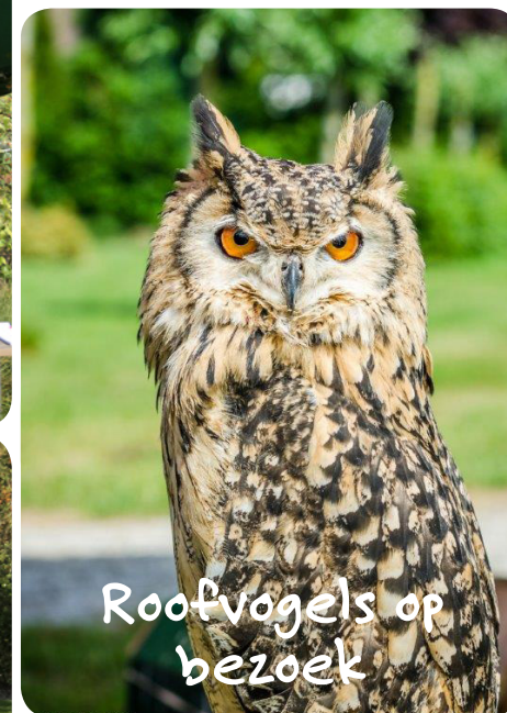
Roofvogels op bezoek